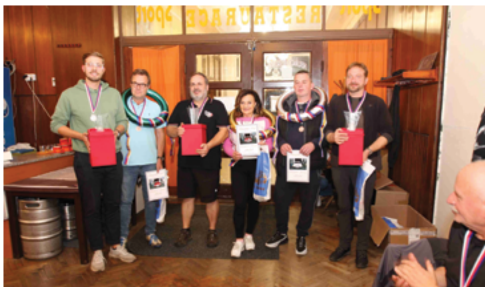
Automotoklub Železný Brod, Historic Jizera 2024, str. 42