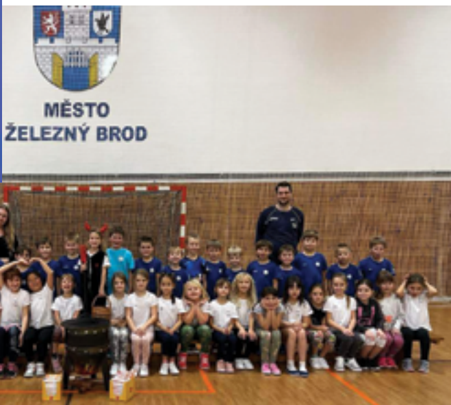
FSA, Mikulášské odpoledne, str. 41