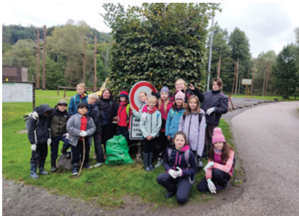
ZŠ Pelechovská, akce Čistá Jizera, str. 29