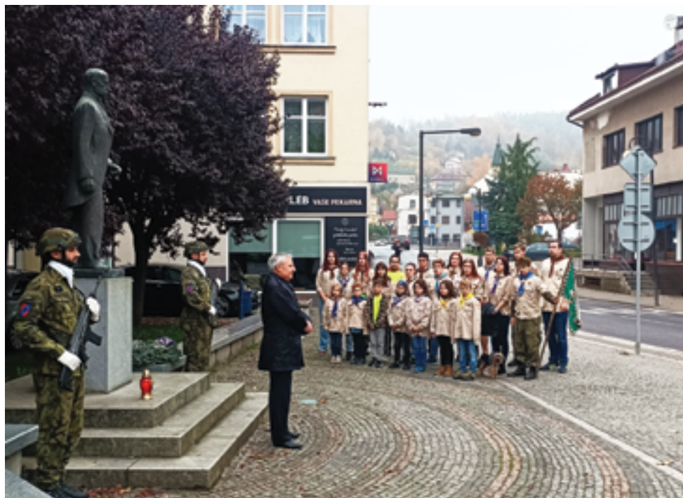
Skautské středisko Údolí Železný Brod, Pietní akt, str. 38