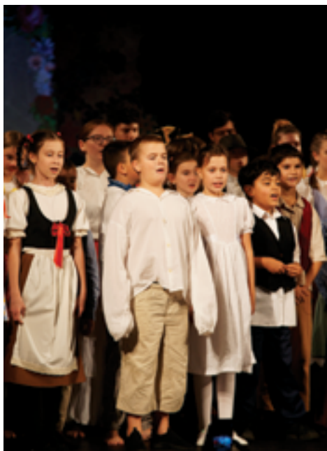
ZUŠ, Proč bychom se netěšili aneb jak jsme (vy)prodali nevěstu, str. 31