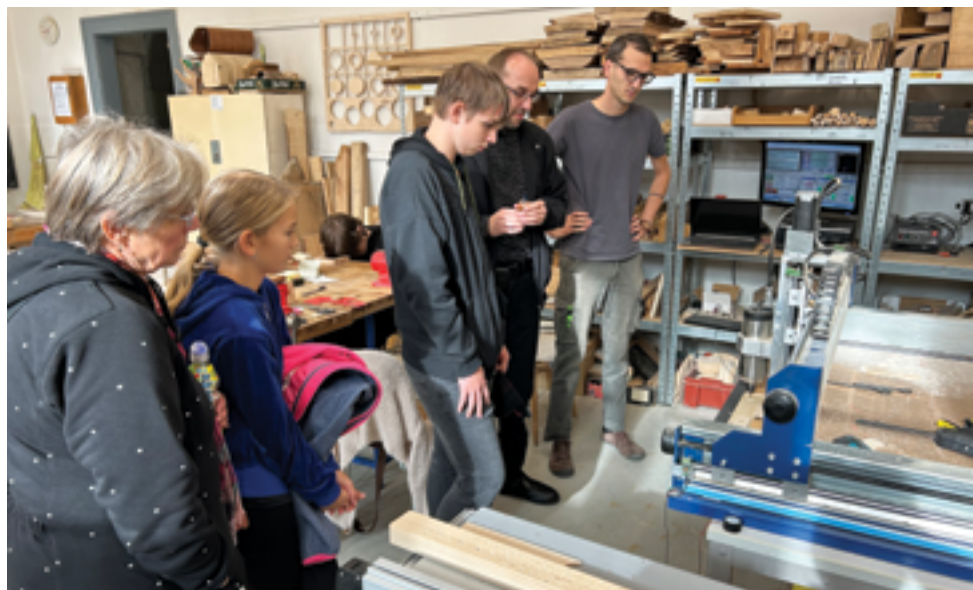
Střední uměleckoprůmyslová škola sklářská, Den otevřených dveří, str. 32