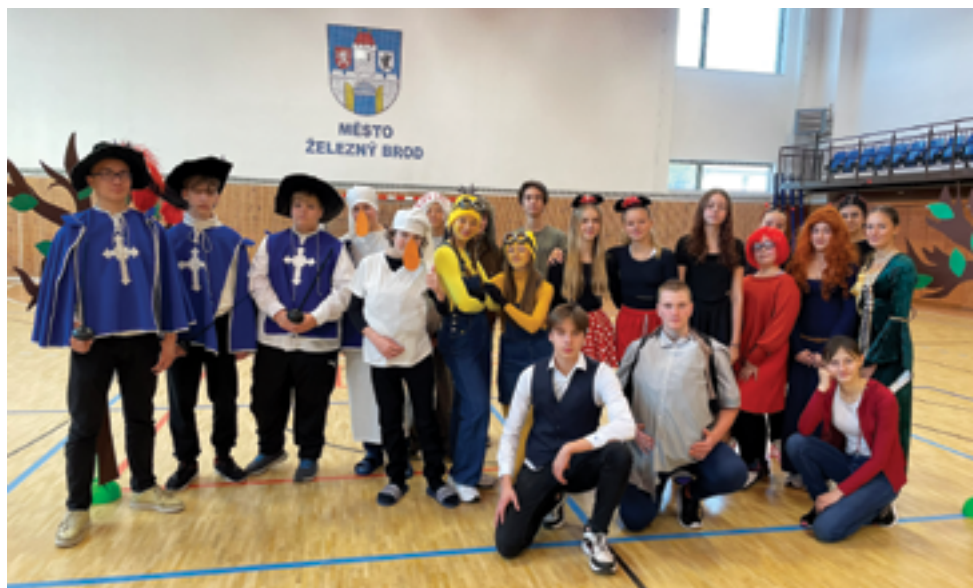
ZŠ Pelechovská, Pohádková školička pro MŠ, str. 29