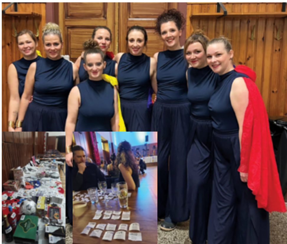
Městský sklářský ples, taneční skupina Divine, účastníci plesu a tombola, str. 5