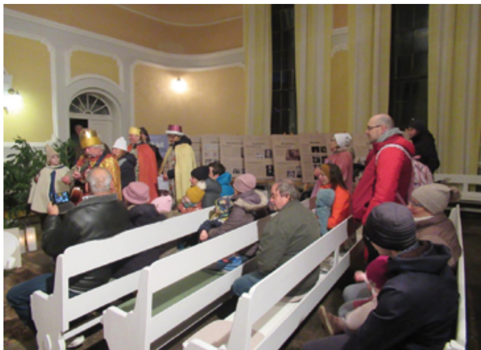
ČCE, Živý betlém, str. 27