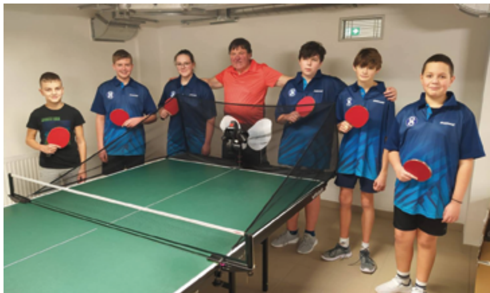
TJ Sokol Železný Brod, oddíl stolního tenisu, str. 32