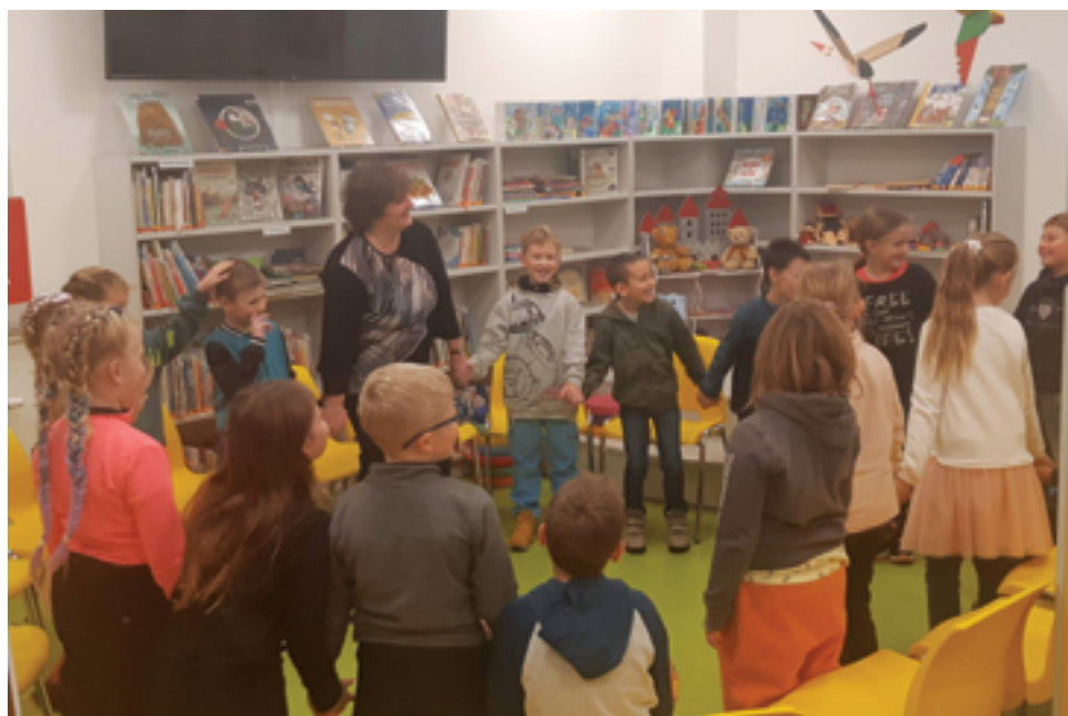
Městská knihovna Železný Brod, Beseda o zvířátkách se ZŠ Koberovy, str. 21