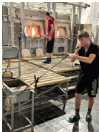
SUPŠS, Výukové hodiny studentů, str. 23