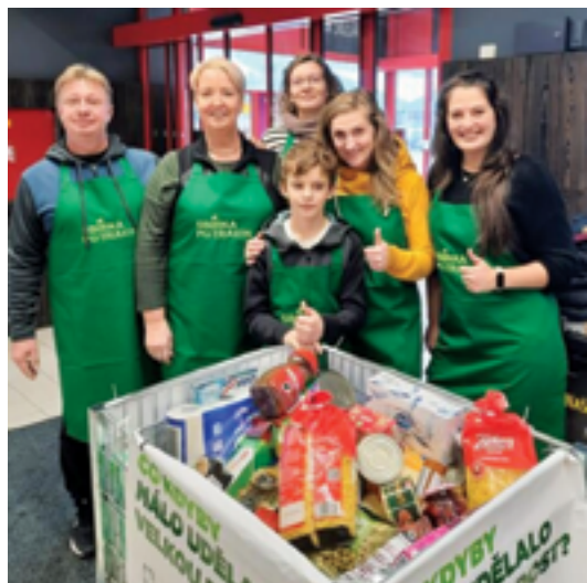
MěÚ Železný Brod, sociální odbor, Potravinová sbírka, více na str. 13