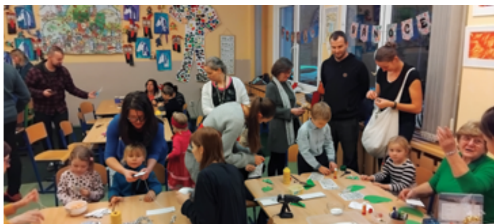
ZŠ Pelechovská, adventní dílničky, více na str. 38