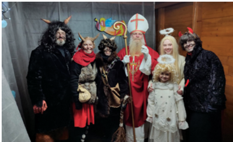
SVČ Mozaika, Peklo v Mozaice, více na str. 43