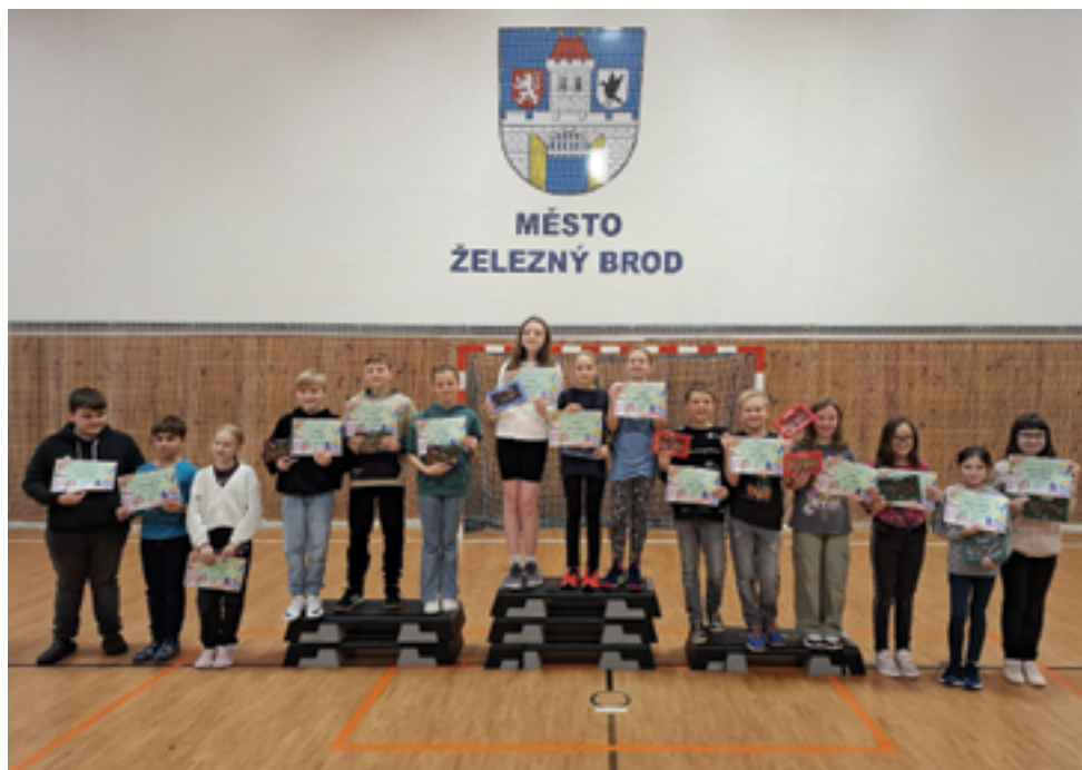
ZŠ Pelechovská, Matematicko-zeměpisná soutěž, více na str. 37