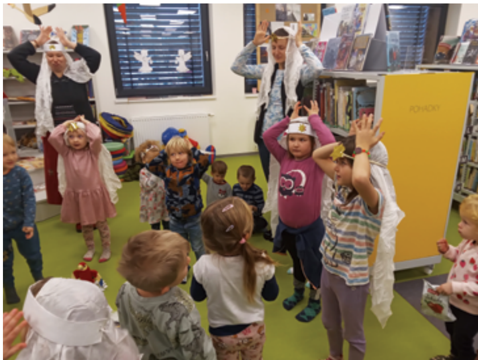
Městská knihovna, Andělský prosincový Bookstart, více na str. 34