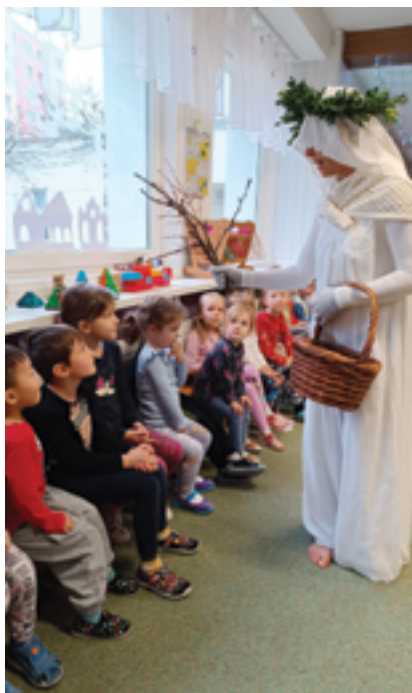
MŠ Na Vápence, Barborka, více na str. 35