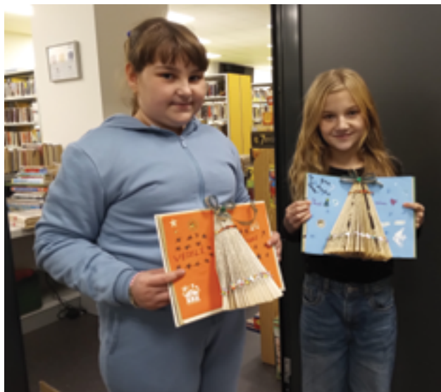
Městská knihovna, Čtenářský kroužek, více na str. 34