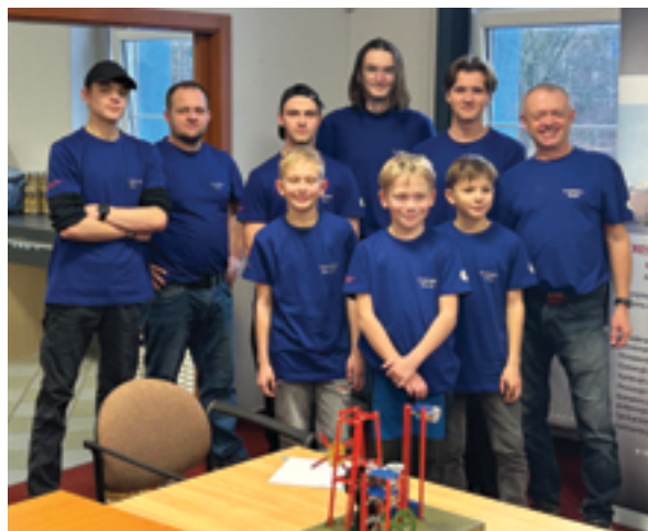
SUPŠS a SVČ Mozaika, Soutěž T-Profi, více na str. 39 a 42